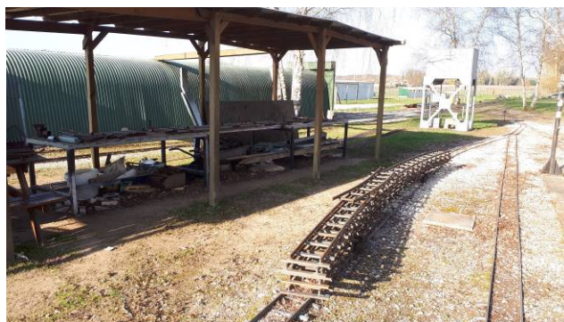
Quelques-uns de la centaine d'éléments à mettre en place